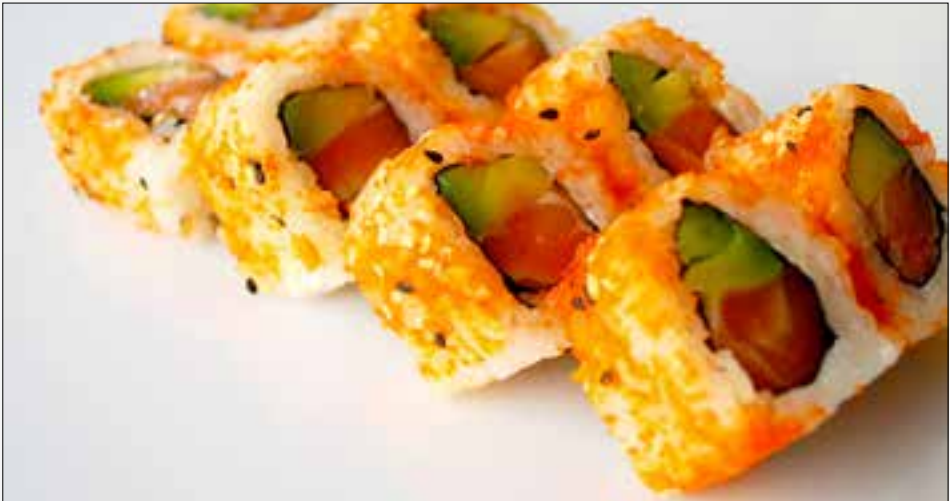
528 Sake b,d,k,4 8 St./pcs. 6,20 Lachs, Avocado, Flugfischrogen, Sesam salmon, avocado, flying fish roe, sesame