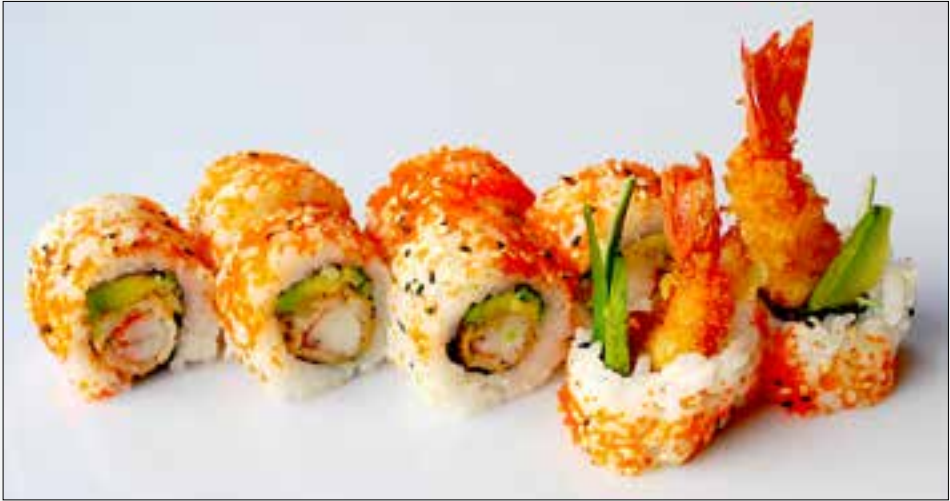
560 Ebi Tempura a,b,d,k,4 4 St./pcs. 4,90 8 St./pcs. 8,50 mit frittierten Garnelen, Gurke, Avocado with fried shrimp, cucumber, avocado