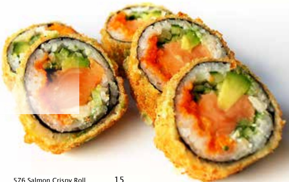
576 Salmon Crispy Roll