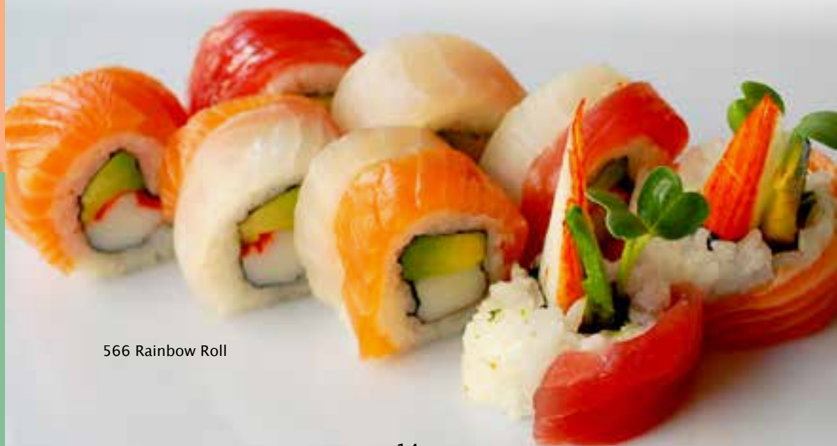
566 Rainbow Roll