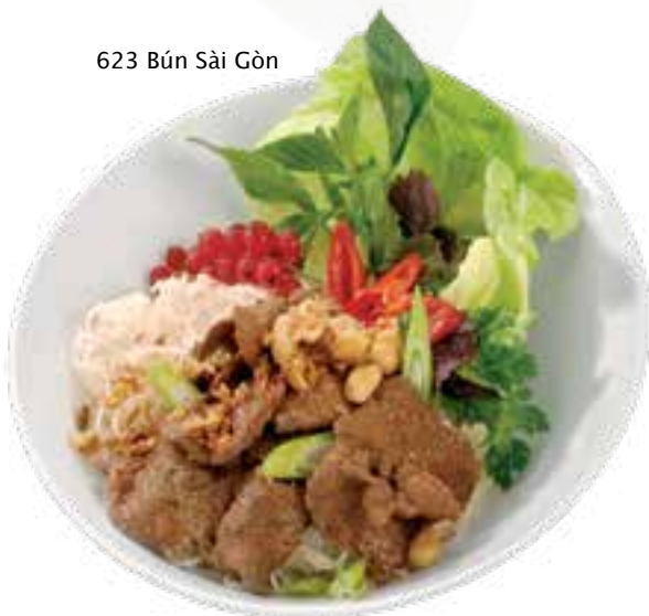
623 Bún Sàì Gòn