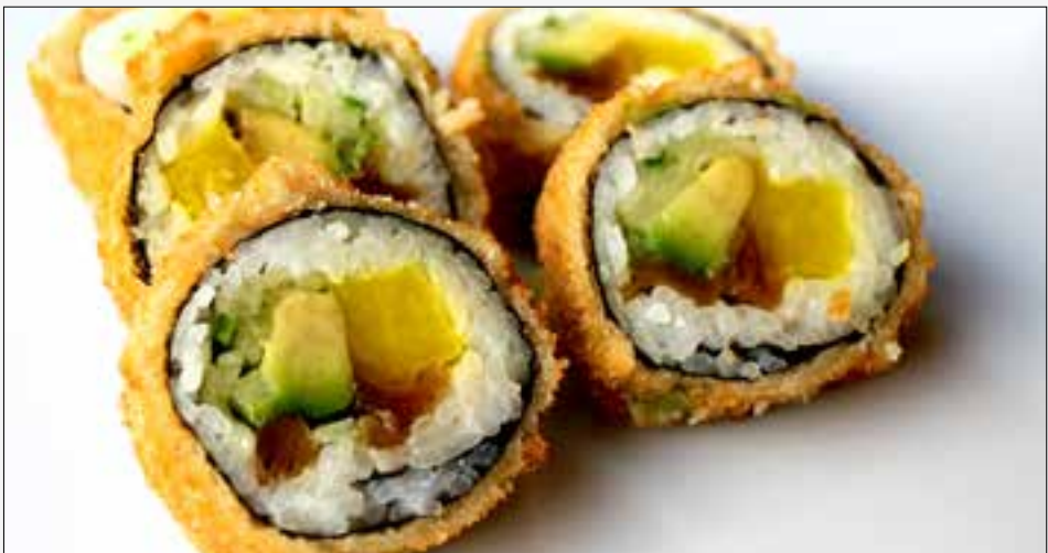
576 Buddha Roll a,b,d,g,k,4 5 St./pcs. 6,90 10 St./pcs. 12,90 Kürbis, Oshinko, Avocado, Gurke, Frischkäse, Lauch, Chili & Sesam pumpkin, oshinko, avocado, cucumber, fresh cheese, leeks, chili & sesame