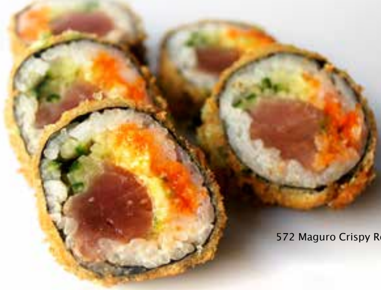
572 Maguro Crispy Roll